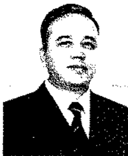
Фахриiddин КОМИЛОВ, Олий Мажлис Қонунчилик палатаси депутаты, юридик фанлари номзоди